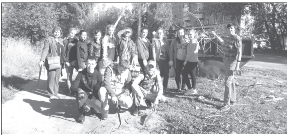
Впереди у нас много полезных добрых дел. Присоединяйтесь!

В прошлом учебном году 5 учащихся, которые активно принимали участие в волонтерской работе, получили личные книжки волонтеров и были зарегистрирова-