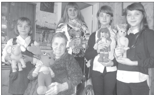
И советы послушали, и игрушки получили.

Хочется пожелать всем пенсионерам крепкого здоровья, долгих лет жизни, благополучия их семьям. Пусть бережное отношение к людям старшего поколения станет делом не одного