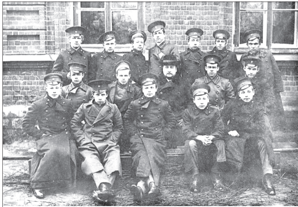
1911 год. Иваново-Вознесенское ремесленное училище, 6 класс.