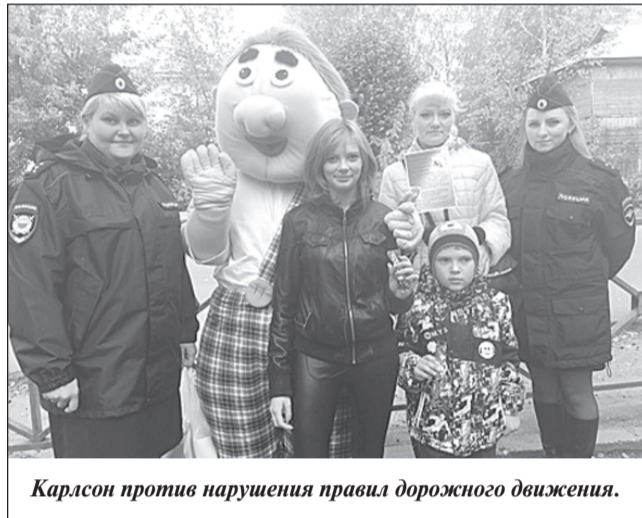
Карлсон против нарушения правил дорожного движения.

стал Карлсон. В ходе акции сотрудники ГИБДД и ПДН вели на улице разъяснительную работу о необходимости использования световозвраща-