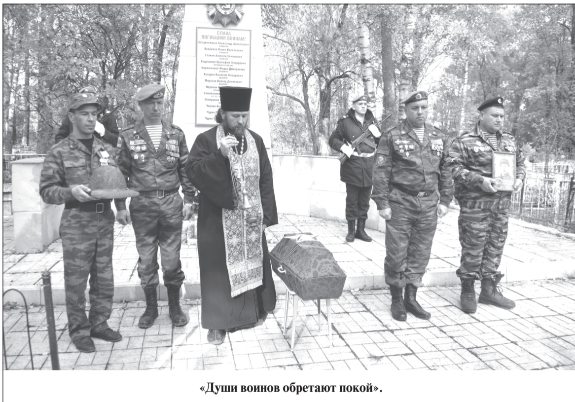
«Души воинов обретают покой».