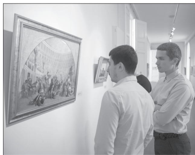
Участники лидерской программы профессионального развития Архитекторы.рф на экскурсии в музее.

Станислав Воскресенский также добавил, что в Ивановской области и дальше будут заниматься благоустрой-