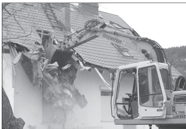
Неправильное оформление необходимой документации ведет к ликвидации самостроя.

Кадастровая палата по Ивановской области призывает ответственно отнестись к оформлению необходимой документации на объекты недвижимости, чтобы ваш дом не ждал последствия ликвидации самостроя.