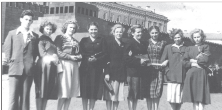
Делегация от Приволжского района на VI Всемирном фестивале молодёжи в Москве.

Ей слово: «Я начинала с секретаря комсомольской организации в колхозе «Красный трудовик», это являлось общественным поручением, основная же моя должность была младший агроном-полевод. Наш колхоз объединял 5 деревень: Ногино, Павлово, Орешки, Козлово, Фомицыно. Тогда комсомольские организации были в каждом колхозе, перед ними стояли задачи воспитывать молодёжь, вдохновлять на труд, организовывать досуг. Это был первый мой опыт общественной работы. В октябре 1955 года меня назначили 2-ым секретарём райкома комсомола, через год — первым. Чем мы занимались? Во-первых, и в главных, вели воспитательную работу. Старались дать молодым людям необходимые знания и привить нужные качества и убеждения. Для этого проводили комсомольские вечера с лекциями, беседами, на которые приглашали для выступлений учителей, руководителей предприятий. У нас даже был так называемый «комсомольский вторник» для этих целей — еженедельные встречи в доме культуры. Ярких событий проводилось много, один из них — молодёжный фестиваль. Сначала мы провели его в своём районе, потом участвовали в областном, а затем поехали в Москву на 6-ой всемирный фестиваль молодёжи и студентов. От нашего района в столицу делегировали 10 человек, среди них были В.Гаркави, директор клуба, Г.Бабочкин из совхоза «Россия» (Толпыгино), Г.В.Ульева, пионервожатая школы № 12, Мария Колосова — лучшая прядильщица Рогачёвской фабрики и др. Об этом фестивале в Москве остались самые восторженные впечатления на всю жизнь.