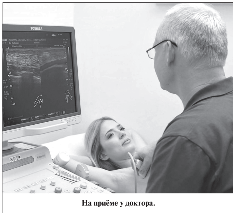
На приёме у доктора.