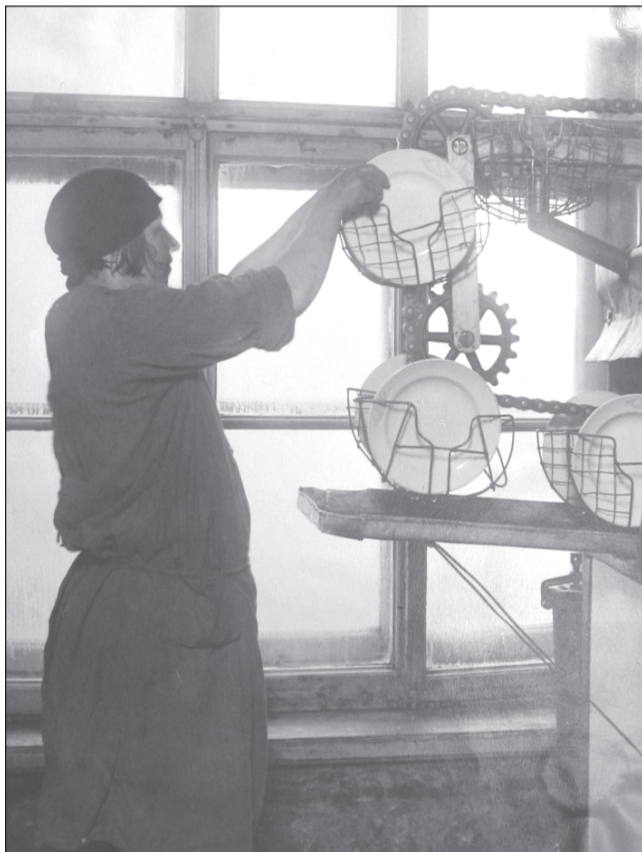
Сотрудница первой в СССР механизированной фабрики-кухни. Иваново-Вознесенск, 1925г.

порциях скрупулёзно было сосчитано количество белков, жиров и углеводов. Предприятие оснастили электрическими мойками, сушилками, хлеборезками, картофелечистками и лифтами-подъемниками. Из Германии привезли 19 котлов, обеспечивающих приготовление 4,5-5 тысяч обедов в день, проектируемая мощность составляла 10-15 тысяч обедов.