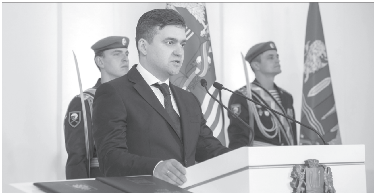
«В полной мере осознаю огромную ответственность перед каждым жителем нашей области».